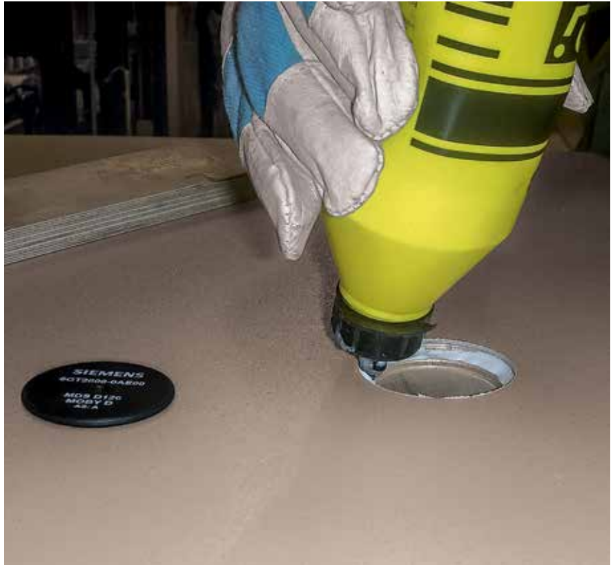
Der Einbau der RFID Chips in die PERI Pave Unterlagsplatte kann auch nachträglich mithilfe des Reparatursets erfolgen.

Hiermit wird vor allem eine Verbindung zwischen der Nass- und Trockenseite hergestellt, sodass eine transparente Rückverfolgung der Produktion möglich ist.