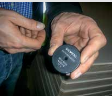
RFID Tags zum Einbau in die Unterlagsplatten: Die Tags haben eine feste einzigartige Nummer, über die das Brett eindeutig identifiziert werden kann.